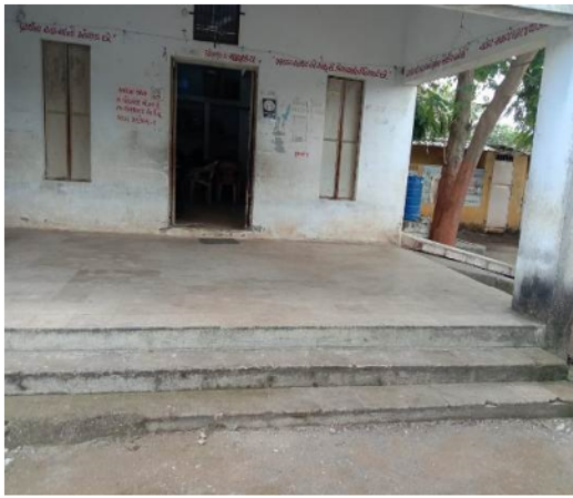
Polling Station Building Front View