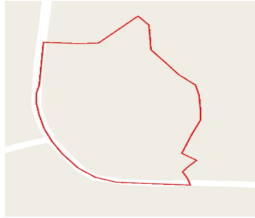
Google Map View